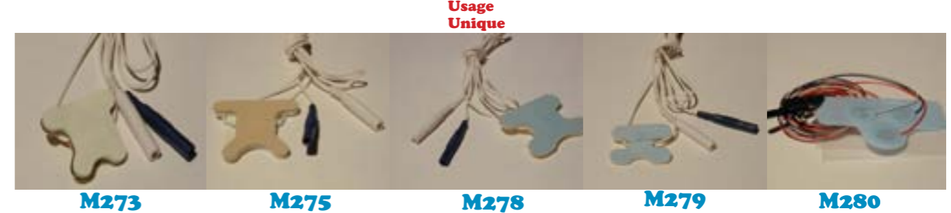
M273 M275 M278 M279 M280