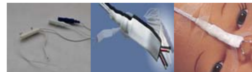
M301 M324 M325